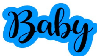
Crédito: Sweet Savannah